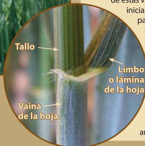
Figura 1. El diagnóstico de las royas requiere de un entendimiento básico de la anatomía vegetal y una revisión rápida de esta información puede mejorar la exactitud del proceso de identificación.

Una vez más, después de varias décadas de control con variedades resistentes a la enfermedad, nuevas razas de la roya del tallo están amenazando a la producción de grano en algunas partes del mundo. El primero de estas variantes, conocida como "Ug99", fue inicialmente reportado en los siguientes países del este africano: Uganda, Kenia, e Etiopía. Variantes adicionales también han emergido, complicando aún más los esfuerzos para contener el problema. La enfermedad continúa extendiéndose y quizás muy pronto amenace a la producción de trigo y cebada de Norteamérica. La detección rápida de nuevas razas es un componente importante de la respuesta internacional a estas amenazas de enfermedades emergentes.