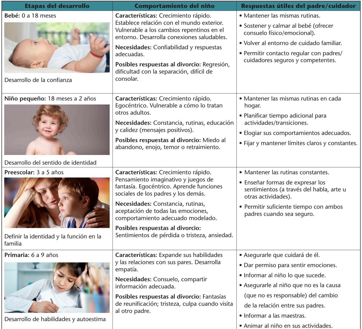
Tabla 1. Etapas del desarrollo del niño y respuestas adecuadas de los padres

necesitan adultos que respondan para apoyarlos en su viaje de desarrollo único a través de la vida. Las sugerencias de la Tabla 1 ofrecen respuestas adecuadas basadas en investigaciones para que los padres y otros adultos, además de modelar el respeto y estrategias saludables para sobrellevarlo, puedan respaldarlos de la mejor forma.